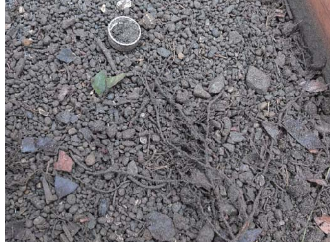
上記写真は、某保育園で使用されている砂場で実際に含まれていた夾雑物。その他、動物の糞害で、非常に不衛生な状況が想定されます。

この「 GS-200 (砂場用除菌・抗菌剤)」なら砂場の衛生管理がとても簡単で、管理コストの削減にも貢献します。